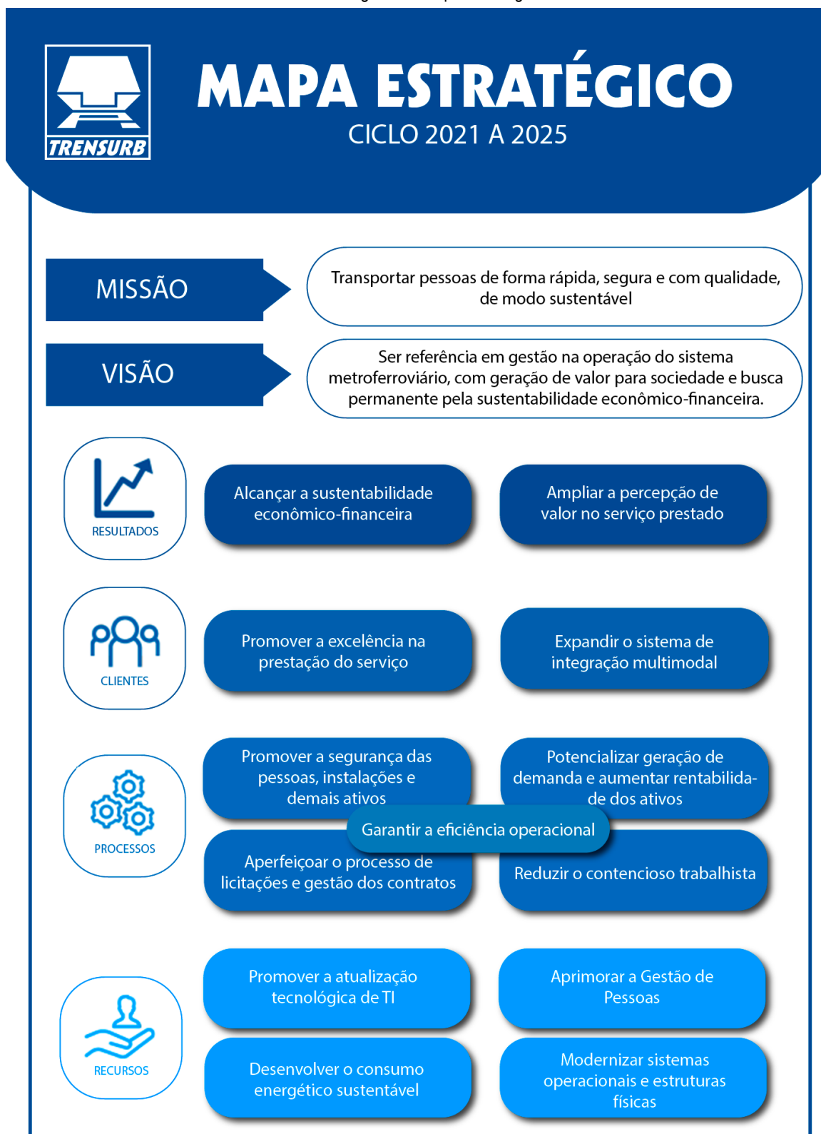
Figura 1 – Mapa Estratégico